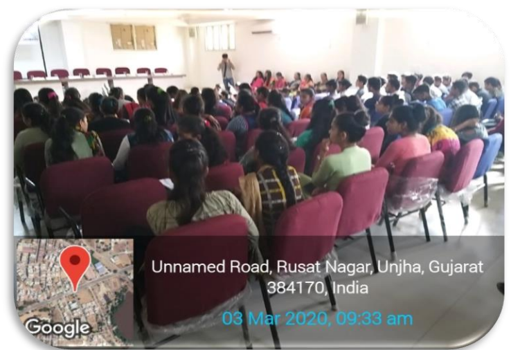
Unnamed Road, Rusat Nagar, Unjha, Gujarat 384170, India