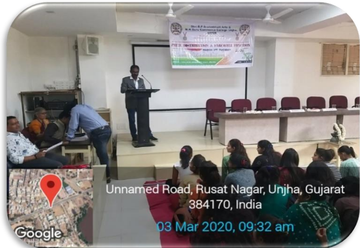
Unnamed Road, Rusat Nagar, Unjha, Gujarat 384170, India