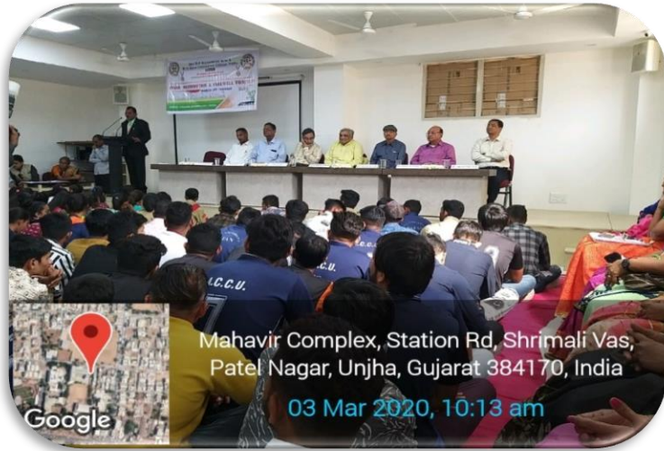
Mahavir Complex, Station Rd, Shrimali Vas, Patel Nagar, Unjha, Gujarat 384170, India